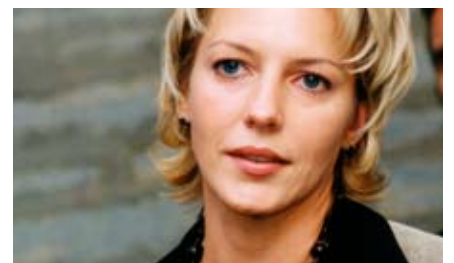
Vilja Savisaar-Toomast Euroopa Parlamendi liige

Hinnast ei saa kindlasti üle ega ümber, sest tap üks Fairtrade saabki olla täna suunatud keskmise või sellest suurema sissetulekuga inimeste jaoks, kellel on võimalus kaubavahelisele emotsionaalsetest argumentidest lähtuda.