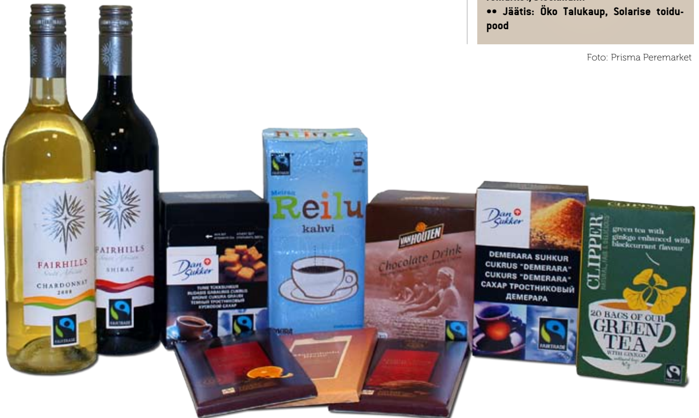
Valik Fairtrade märki kandvatest toodetest, mida müüakse Prisma Peremarketis