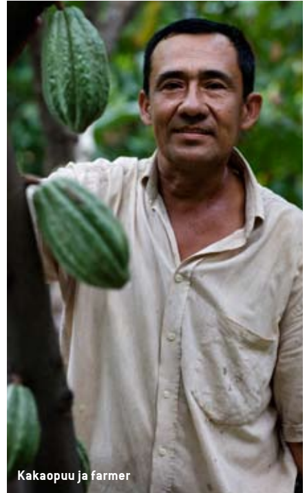
Kakaopuu ja farmer

ga vastajate seas. Samuti teavad seda märki toodetelt otsida juhttöötajad, õpilased/üliõpilased, tallinlased ja jõukamad inimesed. Märksa vähem teatakse märki väikelinnades ja maapiirkondades.