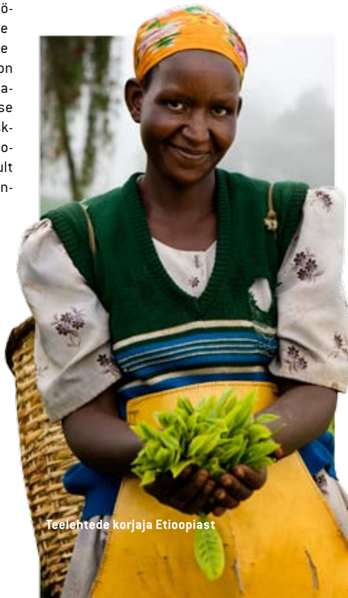
Teeliste korjaja Etiopiast

Euroopasse Guatemala väiketalunike ühistu toodetud kohv. Holland oli esimene riik, kes alustas toodete sertifitseeritud märgistusega Max Havelaar. 1997. aastast alates sätestab standardid tootmisele ja kauplemisele Fairtrade Labelling Organization International, FLO, mis on katuseks õiglase kaubanduse assotsiatsioonidele tarbijauhiskondades ja tootjavõrgustikele arengumaades. Kuni 2004. aastani oli eri riikides kasutusel erinevad sertifitseerimismärgid. Siis võeti kasutusele lehitava inimese kujuga sinirohemust märk. Fairtrade on rahvusvaheliselt registreeritud märk ja seda ei tohi kasutada meelevaldselt.