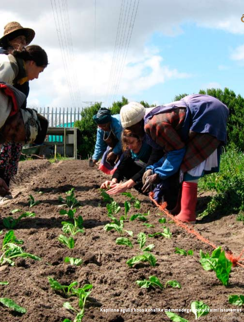
Kaplinna agulis koos kohalike memmedega pinnatähti istutamas