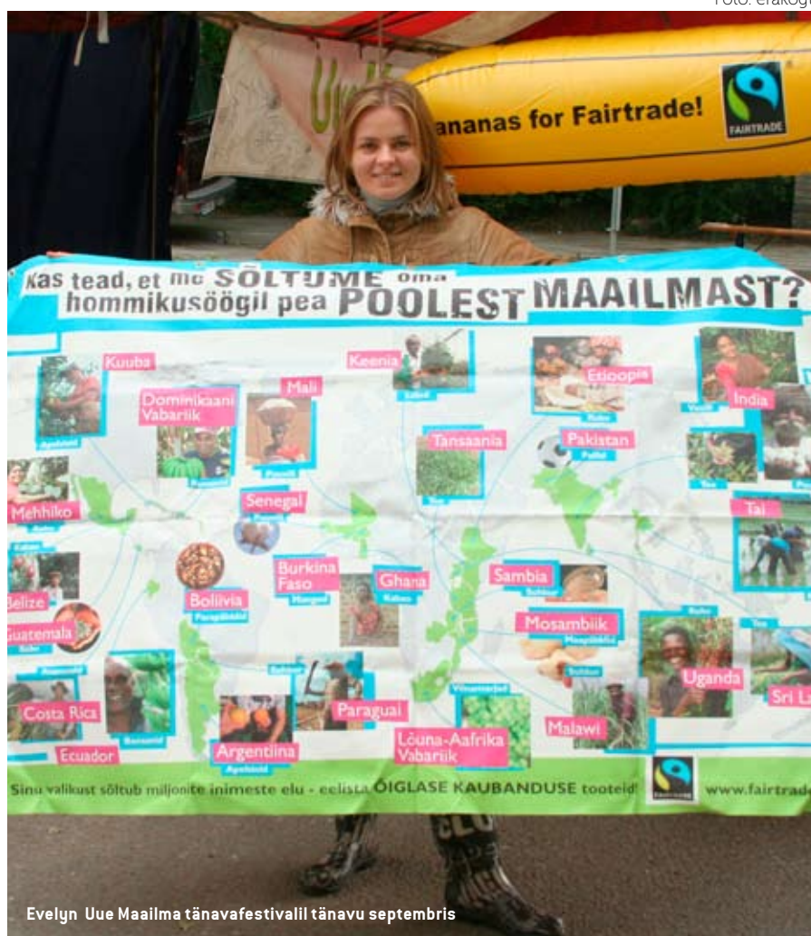
Evelyn Uue Maailma tänavafestivalil tänavu septembris

Rääkida tuleks nii, nagu tegelikult on. Kindlasti tuleb arvesse võtta seda, et vaatamata kõigele ei taheta tihtipeale sellistel teemadel rääkida ja isegi mõelda. Inimestel tekib